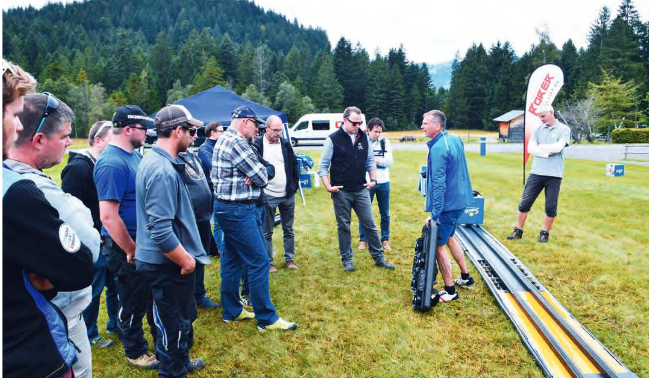
Interessiert lauschten die Besucher den Erklärungen der Fachleute. Aber auch getestet wurde ausgiebig.